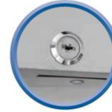
Serrure de porte