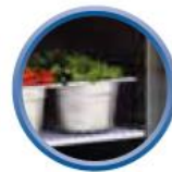
Grilles sur glissières