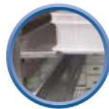
Kit 600x400 en option