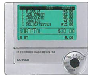
Écran opérateur 10 lignes LCD