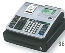
SE-S400 avec tiroir S